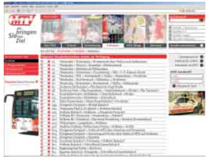
Unten Startseite, oben Inhaltsseite der neuen MTV-Website, der ein Extranet für Entscheider aus Kommunalverwaltungen und Politik hinzugesellt wurde.

begrüßt: Die MTV erfüllt mit ihrem Webauftritt deutsche wie internationale Anforderungen an die „Barrierefreiheit“. Menschen mit Seh- und anderen Behinderungen können sich dennoch auf dieser Seite zurechtfinden. Gerade dieses Kriterium erforderte vielfältige Korrekturläufe in jeder Entwicklungsphase des neuen Designs, das frisch wirken, aber dennoch stets den vertrauten MTV-Look erkennen lassen sollte – was gelang.