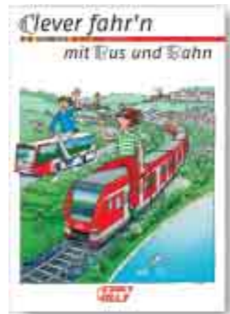
Diese 16-seitige Broschüre enthält alles, was Fahrschüler wissen müssen, um sicher mit Bus und Bahn den Schulweg zu überbrücken. Wenn sie nicht an Ihrer Schule ausliegt, sendet Ihnen die MTV ein Exemplar zu.