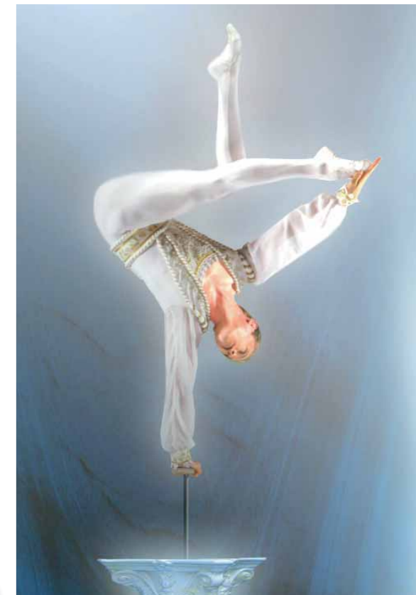
Tipps für Ihre Erlebnis-Tour in 2009: Tigerpalast Walhalla Theater Wiesbaden Eissporthalle Mainz

Und auch bei der Benutzung von Bus und Bahn können Sie sparen. Nicht nur Benzin und Zeit für die Parkplatzsuche, sondern auch eine Fahrkarte für Ihre Begleitperson. Denn an jedem Wochenende, ab Freitag 19.00 Uhr bis Sonntag Betriebschluss, und an bundeseinheitlich geregelten gesetzlichen Feiertagen sowie am 24. und 31.12. ganztags, dürfen Sie mit nur einer Einzelfahrkarte für Erwachsene im RMV zu zweit unterwegs sein. Das ist unser sogenannter RMV-Weekend-Rabatt. Denn schließlich sollen Sie Ihren erlebnisreichen Tag stau- und stressfrei beginnen und ebenso beenden. Und wie Sie zu Ihrem Wunschziel kom-