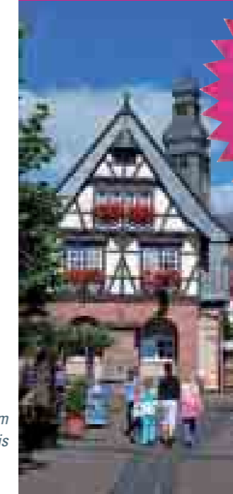
Kurhaus Wiesbaden