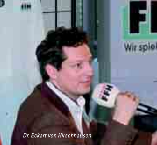
Dr. Eckart von Hirschhausen