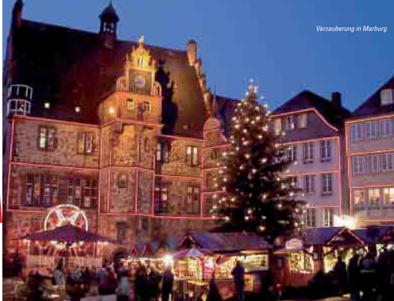
Verzauberung in Marburg

Holen Sie sich die neue RMV-XtraTour „Weihnachtsmärkte“ in Ihrer nächstgelegenen RMV-Mobilitätszentrale oder an einer der RMV-Vertriebsstellen ab. Sie können Ihr Exemplar auch per Post ordern unter Rhein-Main-Verkehrsverbund, Alte Bleiche 5, 65719 Hofheim.