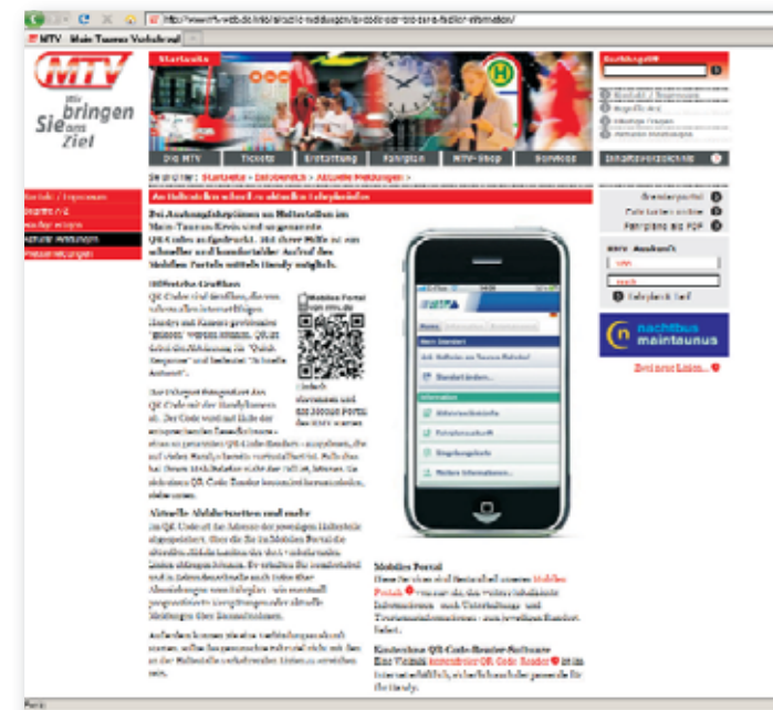
www.mtv-web.de: Tickets kaufen und vieles mehr

Schneller geht's nimmer: Das Internet ist für immer mehr Menschen die schnellste Informationsquelle. Deshalb hält die MTV für ihre Kunden ihre Internetseite stets aktuell.