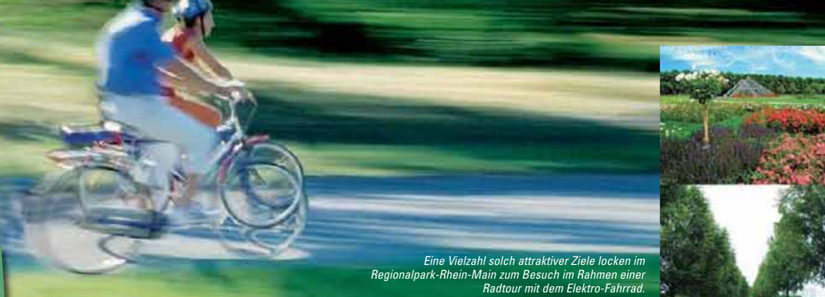
Eine Vielzahl solch attraktiver Ziele locken im Regionalpark Rhein-Main zum Besuch im Rahmen einer Radtour mit dem Elektro-Fahrrad.

Alle Informationen und Ansprechpartner sind im Internet unter www.mtv-web.de zu finden.