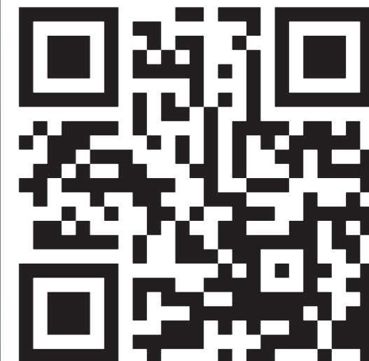
Künftig an immer mehr Haltestellen im RMV: QR-Codes.

Der RMV baut zur Zeit ein Netz von ortsbezogenen Zugangspunkten in Form von QR-Codes und NFC-Tags an den Haltestellen auf. Die QR-Codes sind an den Aushangfahrplänen der Haltestellen angebracht und beinhalten den stationsbezogenen Aufruf des RMV-HandyPortals. Nach dem Scannen des QR-Codes mit einem QR-Code-Reader gelangen Sie direkt zur Startseite des RMV-HandyPortals. Testen Sie es mit dem oben abgedruckten QR-Code! Eine Vielzahl kostenloser QR-Code-Reader sind im Internet erhältlich – sicherlich auch der passende für Ihr Handy.