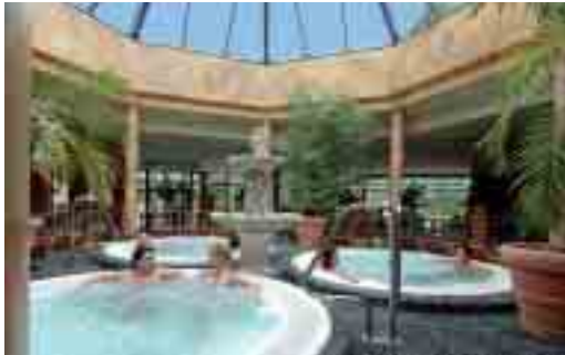
Die Rhein-Main-Therme in Hofheim ist neuer Partner der RMV-ErlebnisCard.

Mit der RMV-ErlebnisCard 2011 können Sie das ganze nächste Jahr die Vielfalt der Rhein-Main-Region neu entdecken. Ganz nach dem Motto: einmal zahlen, aber zu zweit erleben.