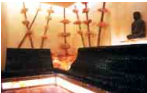
In der Salzlounge im Schwebbad Oberursel herrscht gesundes Meeresklima.