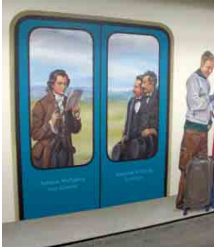
Berühmtheiten unter sich: Goethe und die Brüder Lumière.

lichen Berufsverkehr, betrachtet er doch das Innere eines Zuges, obwohl er sich selbst noch auf der über dem Bahnsteig liegenden Ebene befindet.