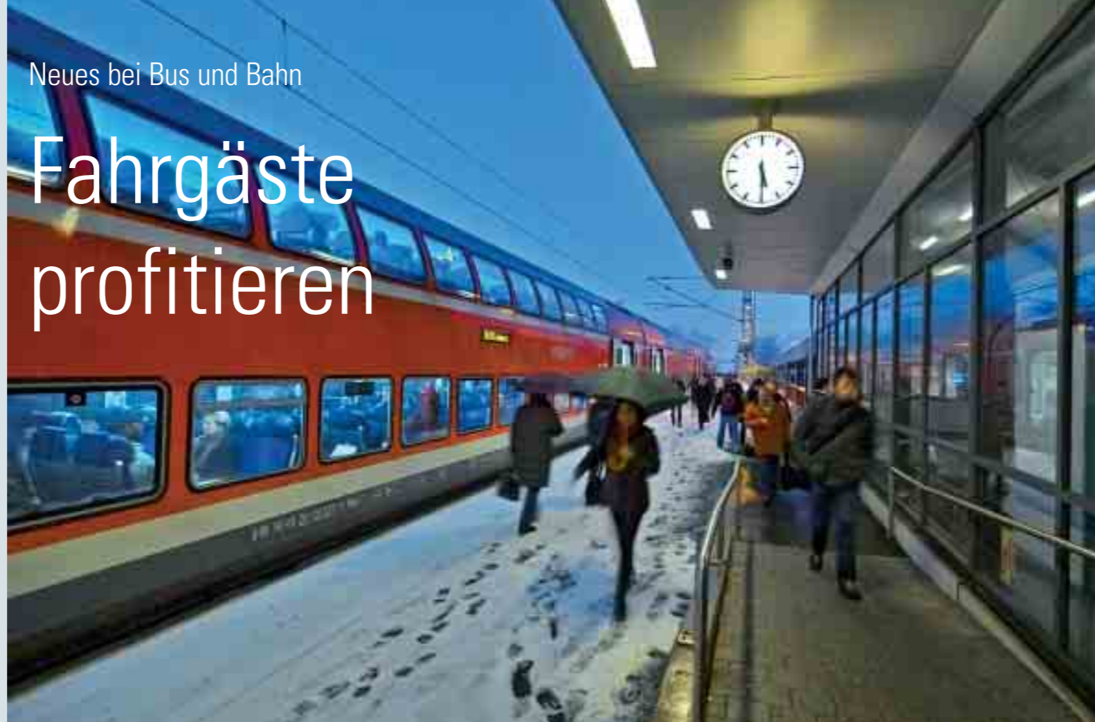
„Blaue Stunde“ am Bahnhof Idstein.

Bald ist es wieder so weit: Am Sonntag, 12. Dezember, findet in ganz Europa der Fahrplanwechsel statt. Auch im RMV-Gebiet gibt es zahlreiche Veränderungen im Fahrplanangebot.