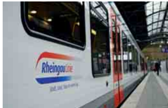
Die fabrikneuen Elektrotriebwagen der Bauart FLIRT gehören zu den modernsten Zügen Europas. Der Name steht für Flinker-Leichter-Innovativer-Regional-Triebzug.

Diesen Namen trägt der Zug zu Recht: ein niedriger Energieverbrauch, ein hohes Beschleunigungsvermögen, eine Höchstge-