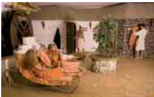
Entspannung pur: der Saunabereich des WellVentures in Griesheim.

Schicke Restaurants, Hotspot-Bars, Wellness-Oasen, interessante Theaterinszenierungen und spannende Ausflugsziele – das alles gibt's auf der neuen RMV-ErlebnisCard 2011. Bei über 160 ausgewählten Partnern mit über 200 Angeboten speisen, feiern, shoppen und erleben Sie nach dem „2 for 1“-Prinzip. Mit dabei sind Angebote in Darmstadt, Frankfurt, Hanau, Offenbach, Mainz und Wiesbaden sowie im Hochtaunus-, Main-Taunus-, Rheingau-Taunus-Kreis ebenso wie im Landkreis Groß-Gerau. Das macht die ErlebnisCard auch einzigartig, denn wer hat schon die ganze Region zum Spartarif auf einer Karte?