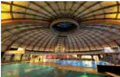
Die Kuppel des Tournesol in Idstein kann im Sommer geöffnet werden.